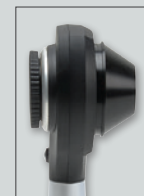
Avec embout de contact