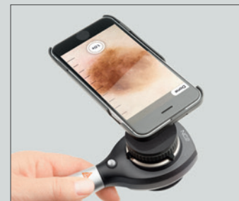
Avec coque d'adaptation pour iPhone