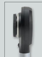
Sans embout de contact